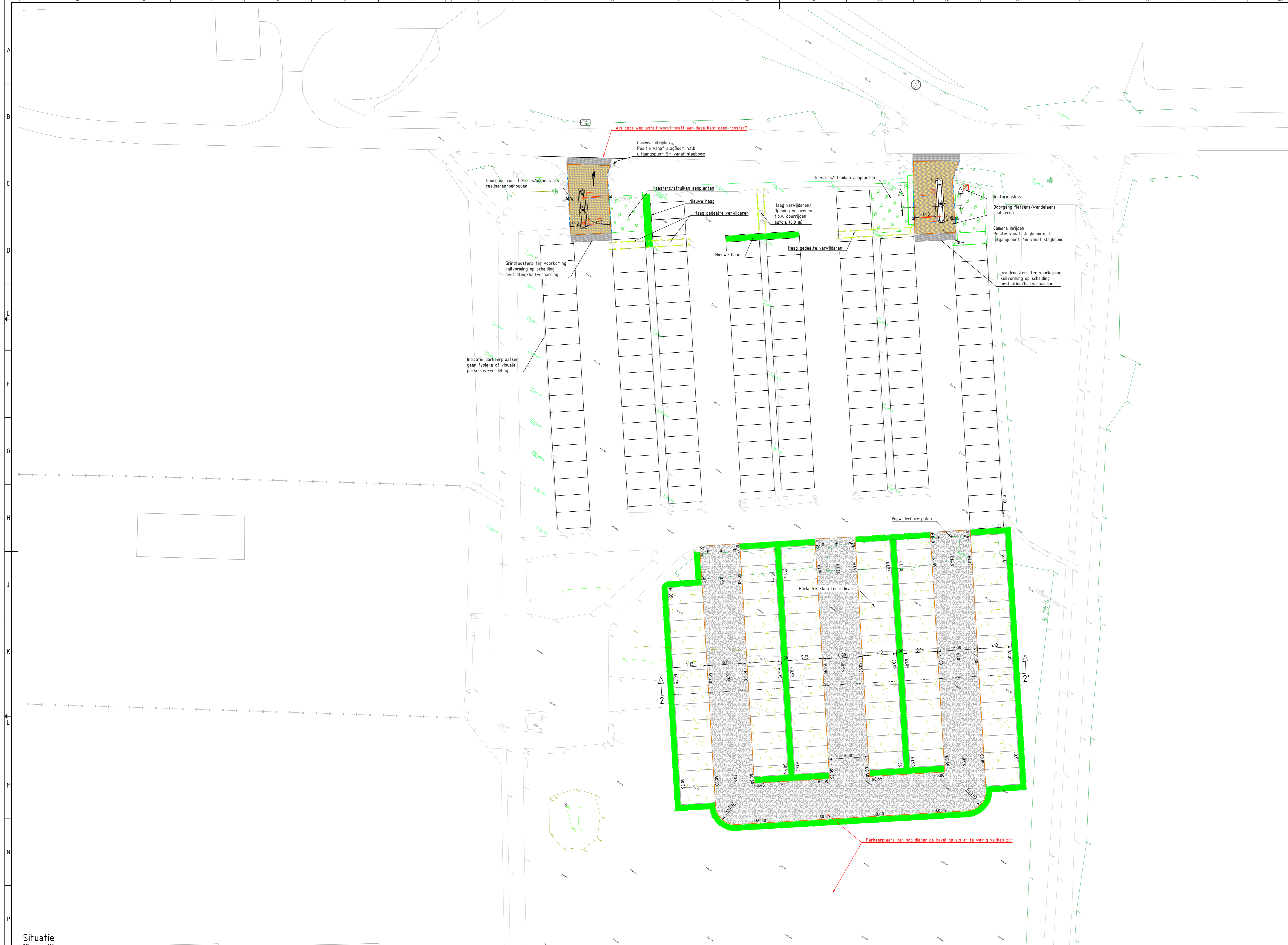
Situatie SCHAAL 1 : 200